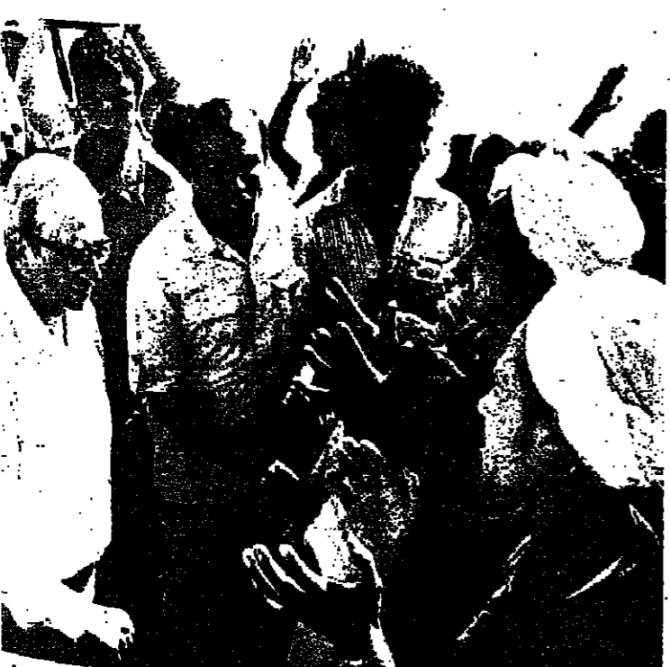
سكان قرية ميت ابو الكوم في استقبال رئيس الدولة السيد اسحق ناسون .